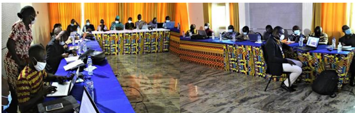
Figure 3: Vue partielle des participants à l'atelier de sélections des étudiants

Le 27 Septembre 2021, des appels à candidature ont été lancés en vue de sélectionner les étudiants pour le Master et doctorat du CERViDA-DOUNEDON, promotion 2021-2022. Pour permettre aux différents acteurs (Responsables académiques, le personnel administratif et technique de l'université et des Centres de formation partenaires du CERViDA-DOUNEDON) d'évaluer les candidatures reçues et de planifier la suite du processus de formation des candidats sélectionnés, le CERViDA-DOUNEDON a organisé du 22 au 27 novembre 2021, un atelier à Notsè.