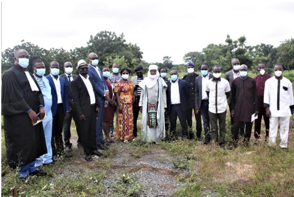
Figure 5: Visite du site du siège

Les consultants devant finaliser le plan architectural et réaliser les EIES sont sélectionnés pour permettre au projet de finaliser les résultats de l'ILD 4.3 d'ici février 2022. Le suivi environnemental et social sera assuré par la cheffe suivi-environnemental du centre, qui a été formée en Tunisie sur les normes de sauvegarde environnementale et sociale de la Banque Mondiale.