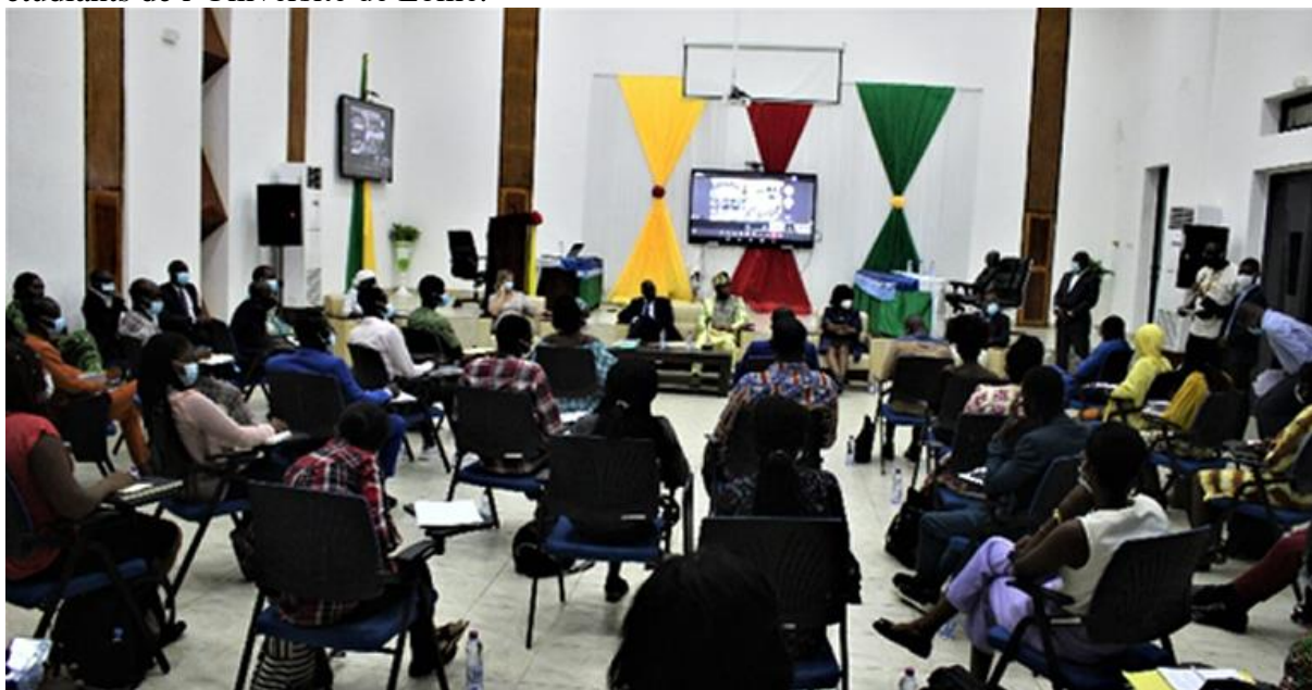
Figure 2: Vue partielle de la salle lors de la visite du Vice-Président

Lomé, 29 octobre 2021- le vice-Président de la Banque mondiale pour l'Afrique de l'Ouest et du Centre, Ousmane Diagana, en visite au Togo a rencontré les autorités togolaises et les étudiants de l'Université de Lomé.