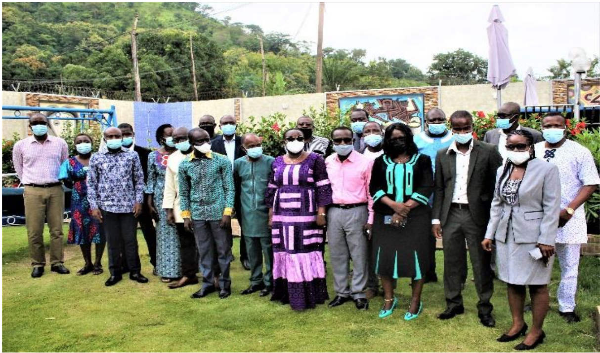
Figure 1: Photo de famille de l'atelier de validation à Kpalimé

Au cours de cet atelier, le Centre a également validé la maquette des formations continues, l'avis d'appel à candidature pour le master et le doctorat et la révision du PTBA de l'année 2021 ainsi que la planification de celui de 2022.