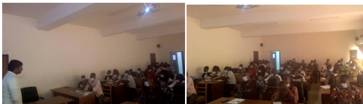
Figure 4: Vue partielle de la salle

Du 22 au 23 juillet 2021, organisation d'un séminaire sur la « Gestion et valorisation de déchets et les possibilités pour le Togo » dans la salle de réunion du West African Science Service Centre on Climate Change and Adapted Land Use (WASCAL).